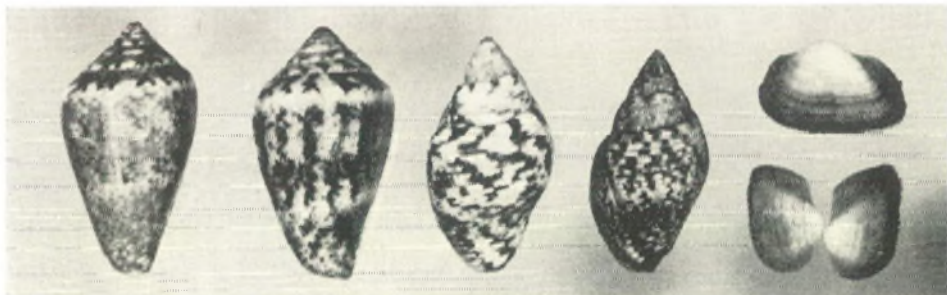
Van links naar rechts: Conus mediterraneus Brug., Pisania maculosa (Lam.) en Arca lactea L.

Hoewel een beetje buiten mijn persoonlijke interessegebied liggend, viel mijn oog toch wel op een Clausilia -soort (landslak), die zich — zeker onbewust van de bijzondere plaats waar hij leefde — tegen de ruïnes op kroop van het oude Romeinse amphitheater van de wereldberoemde stad Epheze, die vanuit de bijbelse verhalen reeds bekend was. Op deze zelfde plaats heeft eens Paulus het evangelie gepredikt. Geen reis met indrukwekkende malacologische resultaten, maar dat had ik u in de aanvang reeds gezegd. Maar toch weer enkele mooie aanwinsten voor de museumcollectie en daarmee waren we toch wel tevreden.