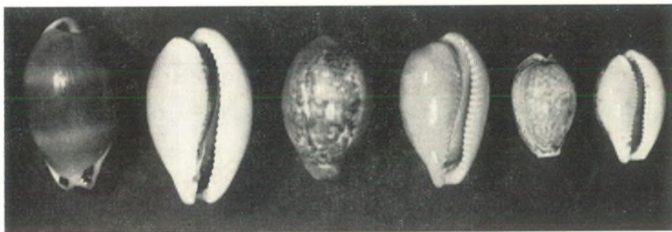
Cypraea -soorten uit de Middellandse Zee.