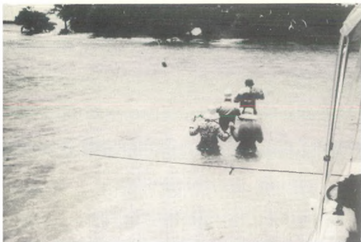
Afb. 2 Dankzij het kristalheldere water konden we wadend verzamelen.

De leden van het gezelschap kijken elkaar ongelovig aan, maar gaan tenslotte, wat aarzelend, geheel gekleed te water. Er staat ongeveer \frac{1}{2} à 1 meter water, zodat wij ons wadende kunnen verplaatsen. De bodem dicht begroeid met zeegras. De eerste sandaal (basketballschoenen waren aanbevolen) verdwijnt al spoedig in de modder en is niet meer terug te vinden.