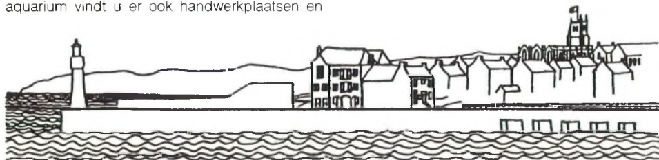
De haven van Penzance.

Plattegrond van het aquarium te Penzance. Niet op schaal. k – kassa; x – de grootste aquarium bak, ongeveer 3,5 m lang; a – een bak met grote kreeftachtigen, zoals de Europese langoest, Palynurus vulgaris Latreille; y – bak met kongeraal en een 7-tal hondshaaien; e – estuariumtank met diverse soorten.