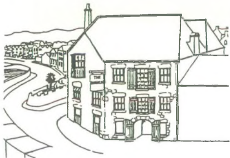
The Barbican, Penzance.

een coffeeshop. Vanaf 10.00 uur kunt u er dagelijks het gehele jaar terecht.