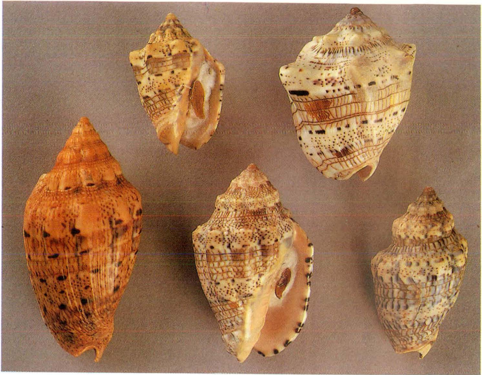
Afb. 4 Voluta musica kent een grote variabiliteit in kleur en tekening. Bovenste rij: exemplaren afkomstig van Parquana, Venezuela; onderste rij: Links: V. demarcoi Olsson, 1965, Patuca, Honduras, in modder, 27 m diep; midden: V. musica , Aruba; rechts: idem, Ned. Antillen. Coll. A. Herlaar.

fera Dall, 1907. Verschil van mening bestaat onder de auteurs over de vraag of Voluta demarcoi Olsson, 1965 een zelfstandige soort is, een ondersoort of slechts een synoniem van V. musica (afb. 4). Dr. Petuch heeft deze slak zelfs ingedeeld in het geslacht Falsilyria Pilsbry & Clinch, 1954, waarin enige fossiele soorten zijn opgenomen.