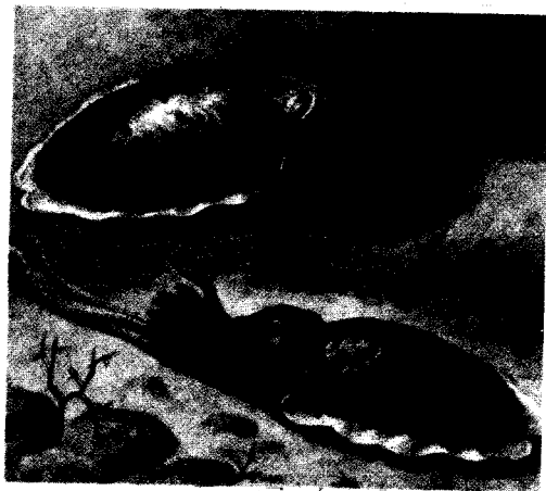
ZEEKAT (Sepia) (m)

Inderdaad ging de bodem zeer stijl naar beneden tot 25-30 meter. We zijn even daar beneden geweest, maar in verband met het hoge luchtverbruik op die diepte zijn we het hogerop gaan zoeken en zijn we hoofdzakelijk tussen 0 en 10 meter geweest. Al enkele malen heb ik in dit blad beschreven wat er, alzo op goede plekken te zien is, maar dit overtrof alles, inclusief