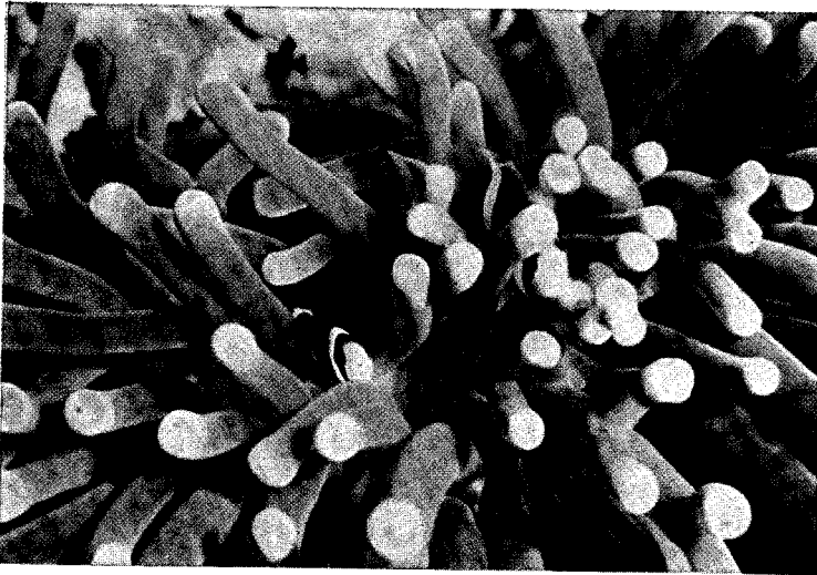
Amphiprion sebae op een zeeanemoon

Het is altijd nodig anemonen, welke niet in gezelschap van anemoonvisjes leven, regelmatig van aanhangend slijm te ontdoen. Bij de anemonen, welke met de visjes samenleven, blijkt dit echter nimmer noodzakelijk. Regelmatig worden zij door de visjes schoon gehouden en zoals wij