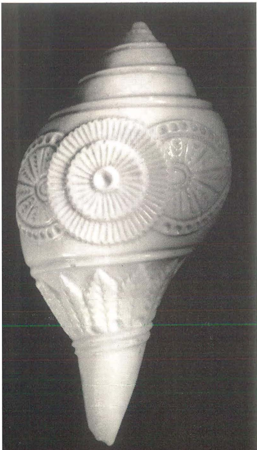
Afb. 2. Niet alleen exemplaren van Xancus pyrum (L.) worden af en toe zeer fraai bewerkt, maar ook exemplaren van andere tot hetzelfde geslacht behorende soorten, zoals het hiernaast afgebeelde exemplaar van Turbinella rapa Lam. Deze 96 mm hoge schelp is afkomstig uit India en werd gekocht in een India-winkel op Curaçao. (Privébezit H. E. Coomans.)

De buitengewone verering, waarmee de linksgewonden schelpen van Xancus pyrum (L.) worden behandeld, blijkt ook uit het gebruik als bewaarplaats van medicijnen door de priesters in de tempels. De schelpen zijn dan dikwijls zorgvuldig besneden of ingelegd met goud en kostbare stenen. Indische vorsten werden niet zelden bij hun kroning met olie uit een in de pagode van de priester bewaarde linksgewonden panchajanya gezalfd. Ook werd deze schelp afgebeeld in het wapen van de staat Travancore evenals op vele postzegels van deze staat. Bovendien werd de schelp als symbool gebruikt op de munten van sommige oude Indische keizerrijken en tot niet zo lang geleden was dit nog het geval bij een muntstelsel van de Radja van Travancore.