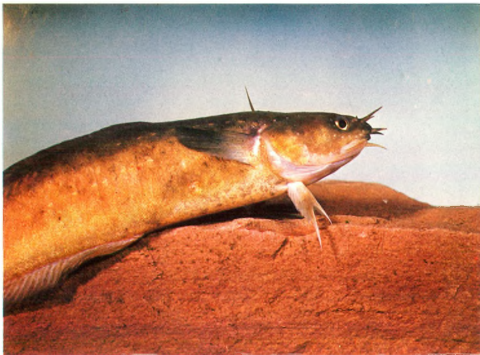
Afb. 1 Gewone meun, Ciliata mustela (L.).

Species: Ciliata mustela (L.) - Gewone Meun